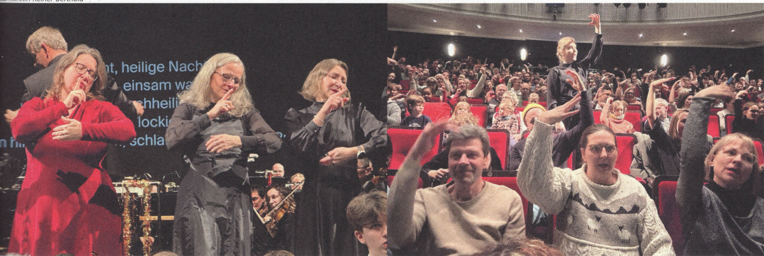
Stille Nacht, heilige Nacht in Gebärdensprache